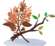
feuilles mortes et petits branchages